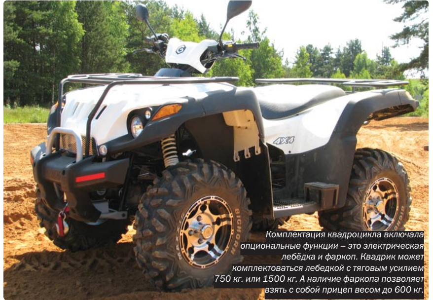
Комплектация квадроцикла включала опциональные функции – это электрическая лебедка и фаркоп. Квадрик может комплектоваться лебедкой с тяговым усилием 750 кг. или 1500 кг. А наличие фаркопа позволяет взять с собой прицеп весом до 600 кг.