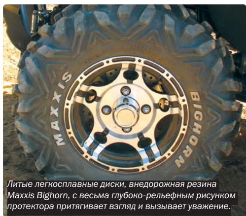
Литые легкосплавные диски, внедорожная резина Maxxis Bighorn, с весьма глубоко-рельефным рисунком протектора притягивает взгляд и вызывает уважение.

Д о нашего знакомства, такого имени – GamaX, я не слышала и тем более не представляла, что за техника выходит из цехов Тайваньской компании с таким именем. Приехав на место тест-драйва, выгружаем квадрик. Ну что же, давай знакомиться: