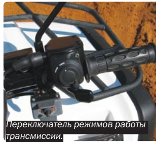
Переключатель режимов работы трансмиссии.