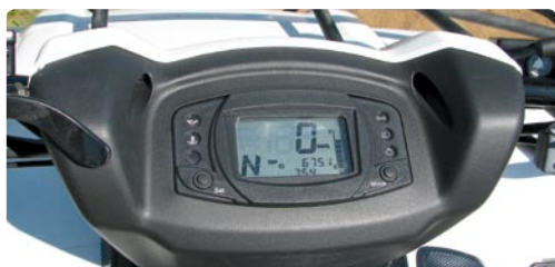
На жк-дисплее сразу бросаются в глаза крупные цифры спидометра и буква, которая указывает, какой режим трансмиссии включён.

Жизнь не стоит на месте. А жизнь на рынке внедорожной техники тем более. И если у давно признанных марок не доходят руки до качественных, но бюджетных моделей техники, то эти места быстро занимают производители Китая, Кореи и Тайваня. И в этом, лично моё мнение, ничего нет плохого. Если потребители-квадроциклисты требуют, то вот вам, пожалуйста.