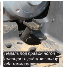
Педаль под правой ногой приводит в действие сразу оба тормоза.