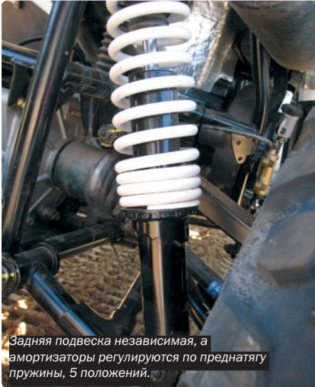
Задняя подвеска независимая, а амортизаторы регулируются по преднатягу пружины, 5 положений.