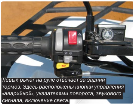
Левый рычаг на руле отвечает за задний тормоз. Здесь расположены кнопки управления «аварийкой», указателями поворота, звукового сигнала, включение света.