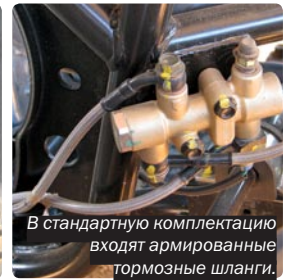
В стандартную комплектацию входят армированные тормозные шланги.

На утилитарных моделях наличие переднего и заднего багажника – это обязательное правило, для «Гамакса» это не стало исключением.